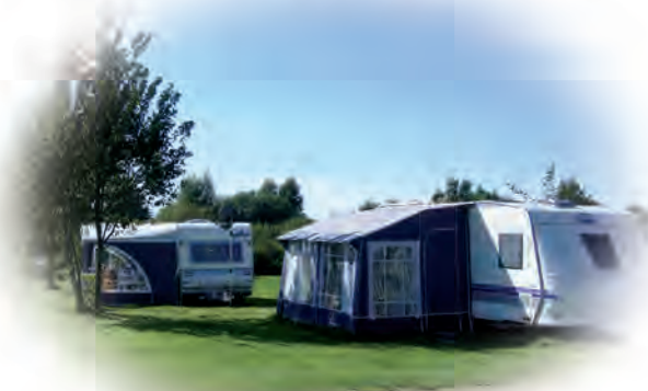
Hobby De Luxe Edition 545 KMF L: 6,25 m, B: 2,37 m

Die Wohnwagen sind neuwertig und sorgfältig ausgestattet mit Koch-, Essgeschirr und Gartenmöbeln. Das Kinderzimmer mit Stockbett eignet sich für Kinder bis zum jugendlichen Alter. Die Wohnwagen eignen sich für 2-3 Erwachsene und 2 Kinder. Dusche und WC nutzen Sie bitte in unseren gepflegten Sanitäranlagen. Bitte bringen Sie Handtücher und Bettwäsche selbst mit. Bettwäsche können Sie auch bei uns für 8,00 €/Garnitur mieten. Auf Wunsch stellen wir Ihnen Handtuchpakete für 4,00 €/Pers. zur Verfügung. Unsere 2 Wohnwagen stehen auf Weesenstein 3 & 4. Haustiere sind nicht gestattet. Eine Hundepension ist in der Nähe, bitte klären Sie im Voraus eine mögliche Unterbringung ab. Eine tägliche Reinigung ist nicht im Preis enthalten.